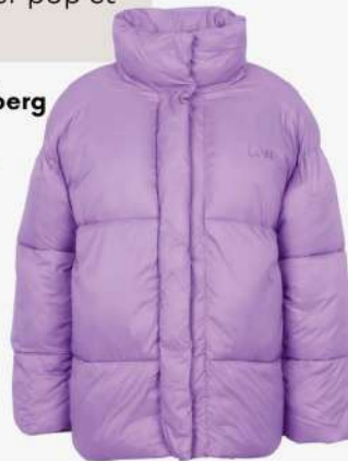
Margaux Lonnerberg 425€ L'Adresse Boutique