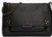
Jérôme Dreyfuss 870€ L'Adresse Boutique