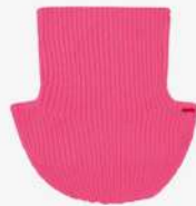
Koon 140€ L'Adresse Boutique