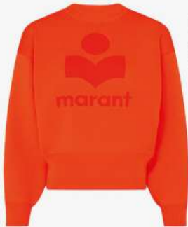
Isabel Marant Etoile 420€ L'Adresse Boutique