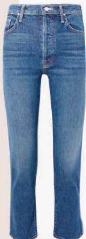
Mother 410€ L'Adresse Boutique