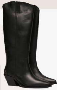
Anine Bing 700€ L'Adresse Boutique