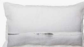
Coussin mer 55€