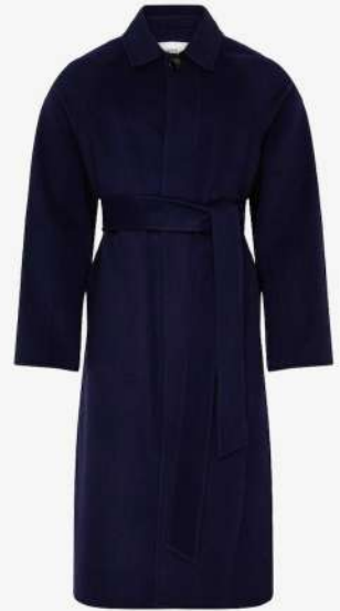
AMI 1350€ L'Adresse Boutique