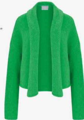
Forte Forte 500€ L'Adresse Boutique