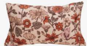
Coussin fleuri 50€