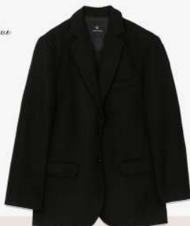
Anine Bing 550€ L'Adresse Boutique