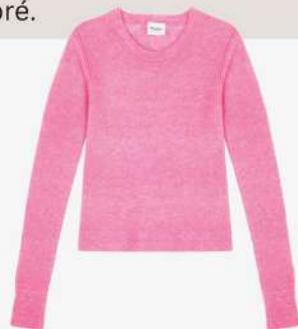
Isabel Marant Etoile 295€ L'Adresse Boutique

L'hiver ne sera pas tout gris cette année. L'Adresse vous a préparé une sélection de toutes les pièces à shopper en boutique pour un hiver pop et coloré.