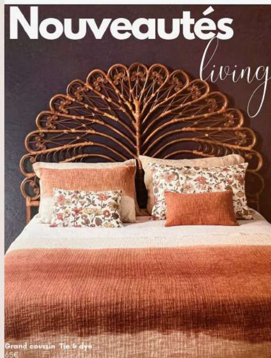
Grand coussin Tie & dye 65€