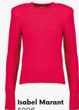
Isabel Marant 590€ L'Adresse Boutique

Vos boutiques L'Adresse seront exceptionnellement ouvertes les dimanches: