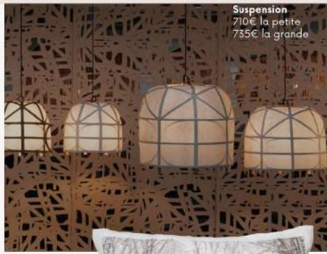
Suspension 710€ la petite 735€ la grande