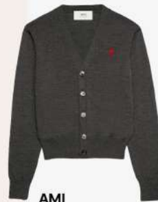
AMI 295€ L'Adresse Boutique