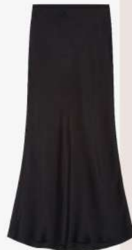
Anine Bing 300€ L'Adresse Boutique