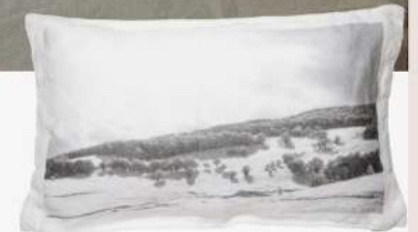
Coussin nature 55€