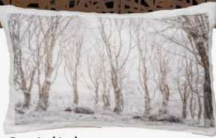
Coussin dégel 55€